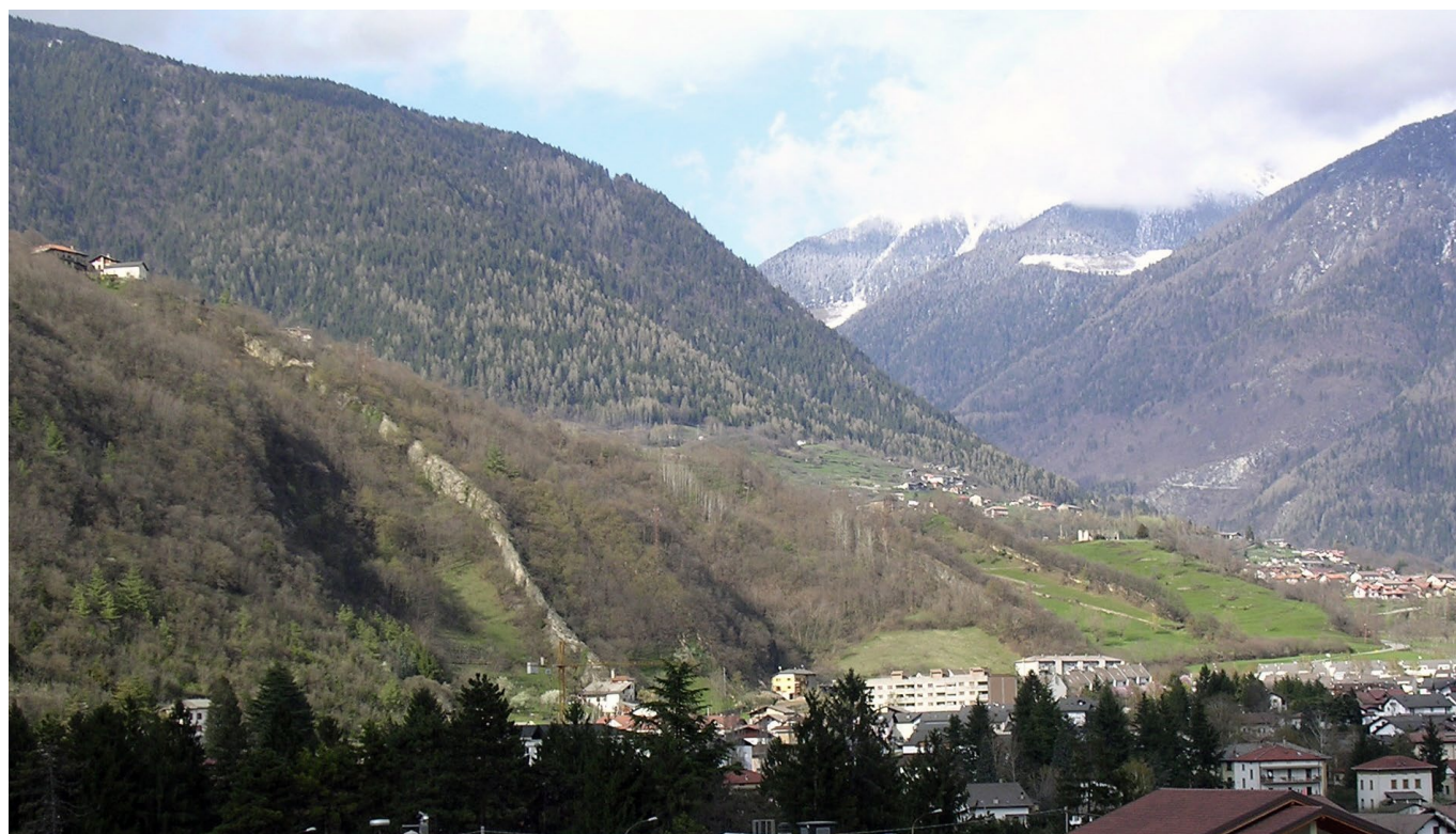
Fig. 1 – Il versante sud del Colle San Pietro (Ciolino) con gli affioramenti paleogenici qui discussi / Fig. 1 – The southern slope of Colle San Pietro (Ciolino) with the Palaeogene outcrops here discussed

Dai livelli più arenacei (Ci-1/2) affioranti alla base della successione nei pressi della frazione Fratte proviene una ricca serie di fossili comprendente molluschi, coralli, echinidi e crostacei. L'esemplare di Leiopedina samusi proviene dalla parte più alta di questi sedimenti (Ci-2) dove si rinvennero frequentemente anche altri generi di echinidi regolari e irregolari.