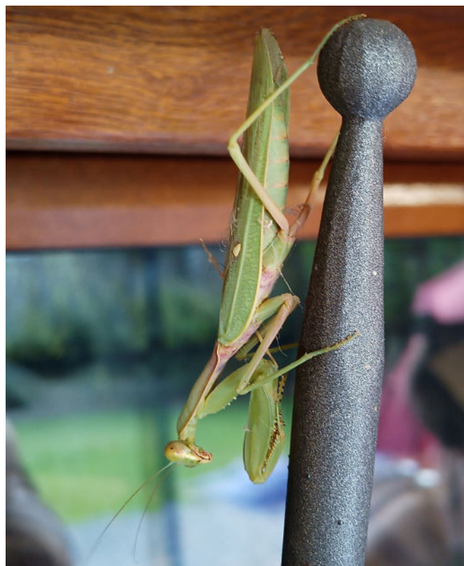
Fig. 1 – Hierodula tenuidentata , ♂ adulto, Cirè-Fratte (frazione di Pergine Valsugana, TN). / Fig. 1 – Hierodula tenuidentata , adult ♂, Cirè-fratte (fraction of Pergine Valsugana, Trentino, Italy).

Il secondo esemplare è stato osservato a Lutago, in Valle Aurina (BZ, Fig. 4 punto 4). L'esemplare in fotografia permette il riconoscimento del genere Hierodula sp., ma non è possibile una identificazione specifica dato che non sono visibili le coxe. Abbiamo ritenuto opportuno segnalare la presenza di questo genere in Valle Aurina in quanto rappresenta la segnalazione più settentrionale per l'Italia, permettendo di ipotizzare che questa specie si stia diffondendo nei fondivalle alpini con rapidità. Riteniamo opportuno citare la presenza in località ancor più settentrionali da quelle riportate nella seguente nota breve, a testimo-