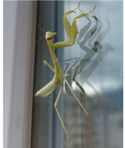
Fig. 3 – Hierodula tenuidentata , juvenile, Viale Druso (Bolzano, BZ). / Fig. 3 – Hierodula tenuidentata , juvenile, Viale Druso (Bozen, Alto Adige/Südtirol, Italy).

Su iNaturalist si trovano osservazioni di entrambe le specie, H. tenuidentata e H. transcucasica ; non essendo considerate in sinonimia, potrebbero generarsi dei problemi legati all'identificazione delle segnalazioni degli utenti. Le segnalazioni riportate in questa nota breve sono state tutte archiviate sul sito iNaturalist.org. Ulteriori osservazioni degli utenti potrebbero definire con più precisione l'areale della mantide nel Trentino-Alto Adige/Südtirol, riportando la presenza in altre località della valle dell'Adige e dei fondivalle alpini.