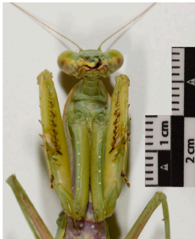
Fig. 2 – Hierodula tenuidentata, ♂ adulto, Cirè-Fratte (frazione di Pergine Valsugana, TN). (MUSE-INV-c017 000956,) / Fig. 2 – Hierodula tenuidentata, adult ♂, Cirè-fratte (fraction of Pergine Valsugana, Trentino, Italy). (MUSE-INV-c017 000956,)