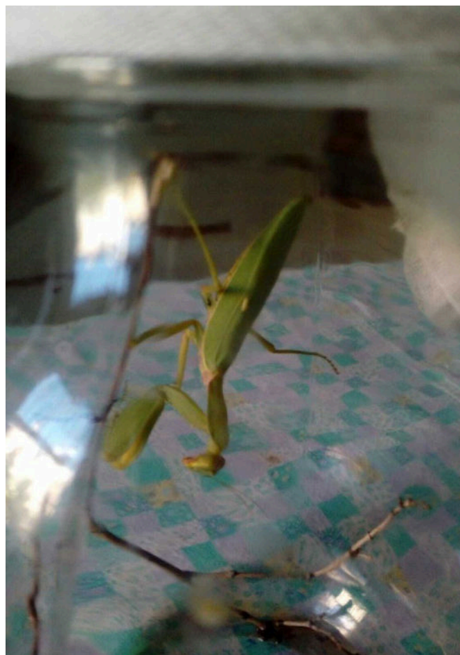
Fig. 5 – Hierodula sp., ♀ adulta, Doss Trento, (Trento, TN). / Fig. 5 – Hierodula cfr. tenuidentata , adult ♀, Doss Trento, (Trento, Trentino, Italy).