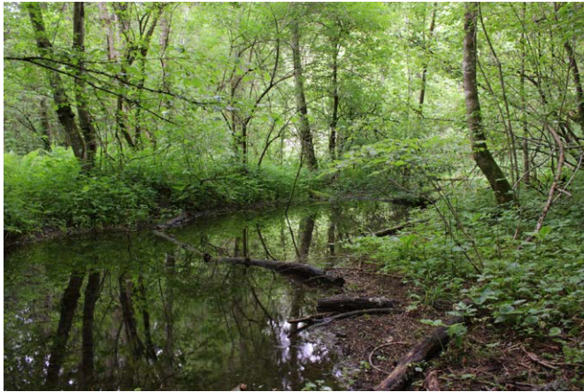
Fig. 3 - Immagine di Ont 3, porzione della ZSC che è risultata avere la maggiore valenza naturalistica e conservazionistica / Picture of Ont 3, the most important part of the ZSC in terms of naturalistic and conservation value.

dana (e.g. Brandmayr & Zanitti 1982; Pilon 1995; Gobbi et al. 2007); diversamente, quelle qui di seguito elencate sono tipiche di boschi umidi del piano montano (di ciascuna vengono indicate qui di seguito alcune caratteristiche ecologiche):