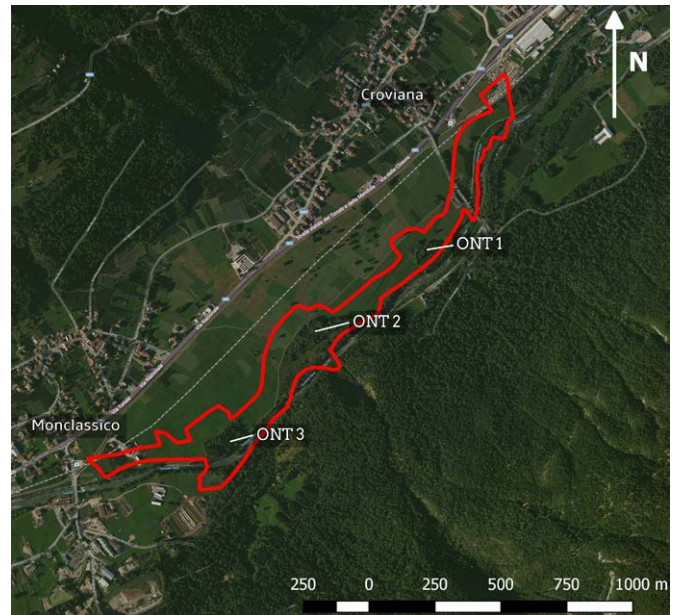
Fig. 1 - Confini della ZSC "Ontaneta di Croviana" e posizione delle tre aree di campionamento / Perimeter of the ZSC «Ontaneta di Croviana» and location of the three sampling stations.

La ZSC Ontaneta di Croviana (IT3120117; coordinate N 46°20'10", E 10°54'04") (Fig. 1) è un'area protetta posta nel fondovalle della Val di Sole (Trentino Alto-Adige) e compresa nel territorio dei comuni di Croviana (TN) e Dimaro Folgarida, frazione Monclassico (TN). Il sito si colloca ai piedi del versante nord-occidentale