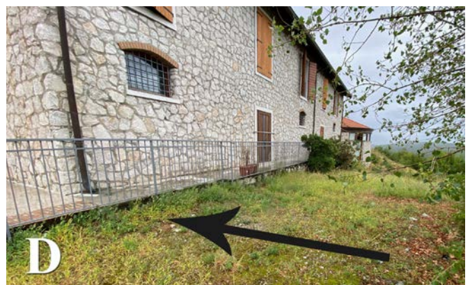
Fig. 1 - Telescopus fallax , giovane osservato a Doberdò del Lago: intero individuo con riferimento dimensionale (A); dettaglio ventrale con cicatrice ombelicale indicata dalla freccia (B); dettaglio della parte anteriore del corpo (C); luogo di ritrovamento, con punto esatto indicato dalla freccia (D). / Fig. 1 - Telescopus fallax , young observed in Doberdò del Lago: whole specimen with dimensional reference (A); ventral detail with umbilical scar indicated by the arrow (B); detail of the front of the body (C); place of discovery, with exact point indicated by the arrow (D).